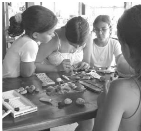
Gyermekkuckókba szívesen betérnek a legkisebbek