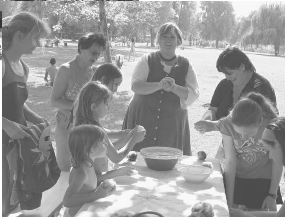
Örömmel nemezeltek kicsik, nagyok