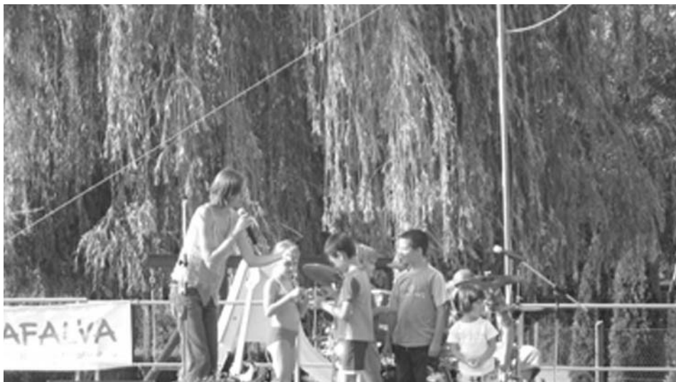
A Magyar Mesezenekar koncertjével a kicsiket szólította meg, a bátrabbakat a műsorba is bevonva