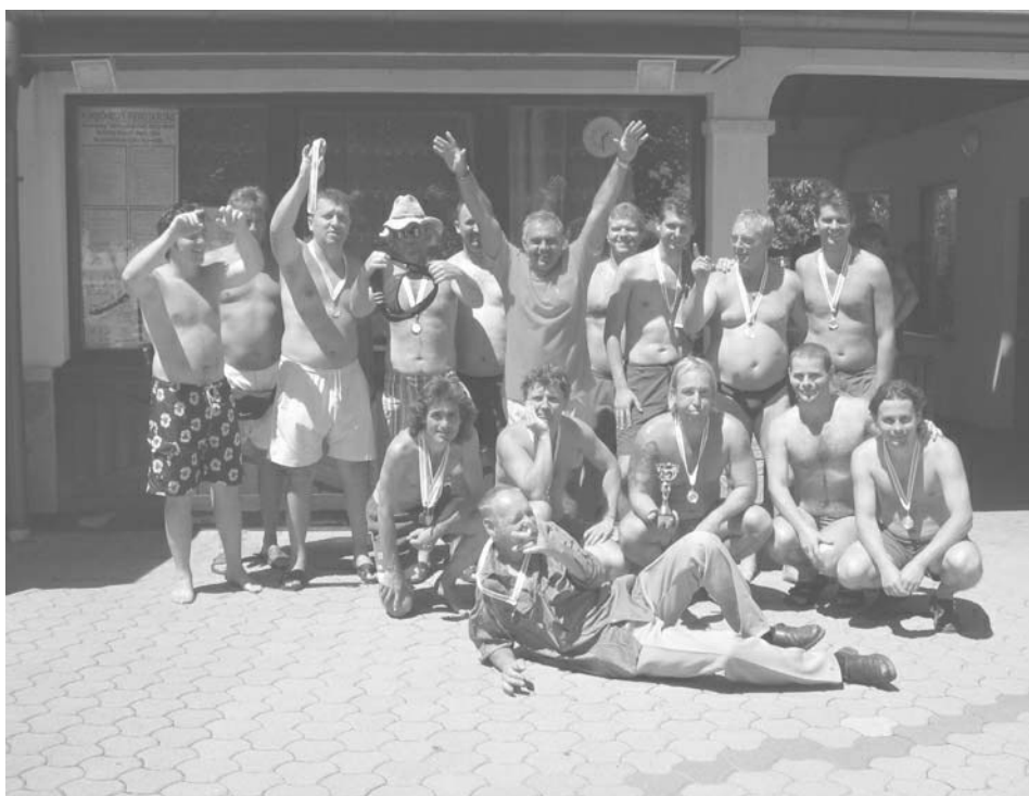
Az udvari strandfocisok

nyeink résztvevőinek köszönjük egész nyári aktivitásukat, a szezonra még további jó játékot kívánunk, és kívánjuk, hogy jövőre is üssenek, rúgjanak labdába!