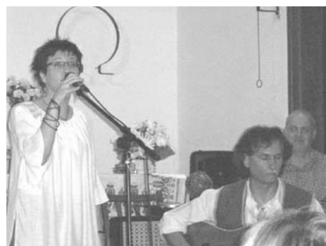
A Light House Music kelta, ír dallamai tetszést arattak a nézők soraiban