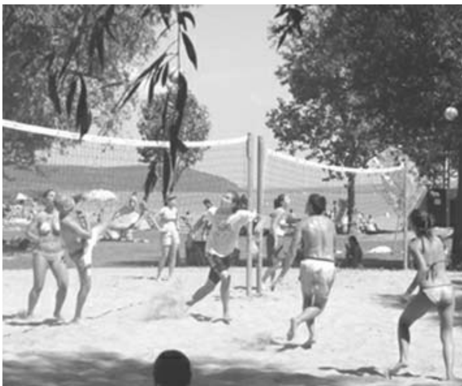
Két pályán küzdöttek a strandröpisek a kupáért