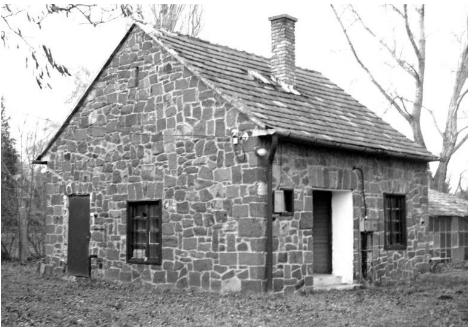
A Balatonudvari Öböl Csónakos Egyesület használatában levő csónakkikötőhöz tartozik a régi halkeltető épülete is.