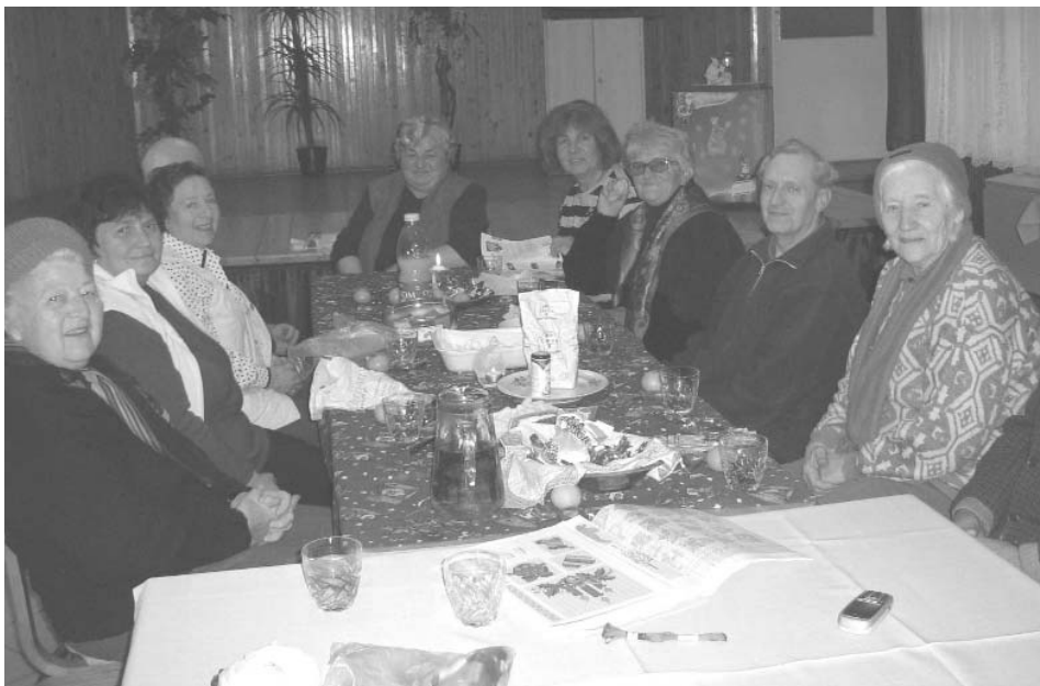
Vidám beszélgetésekkel telnek a foglalkozások a nyugdíjas klubban