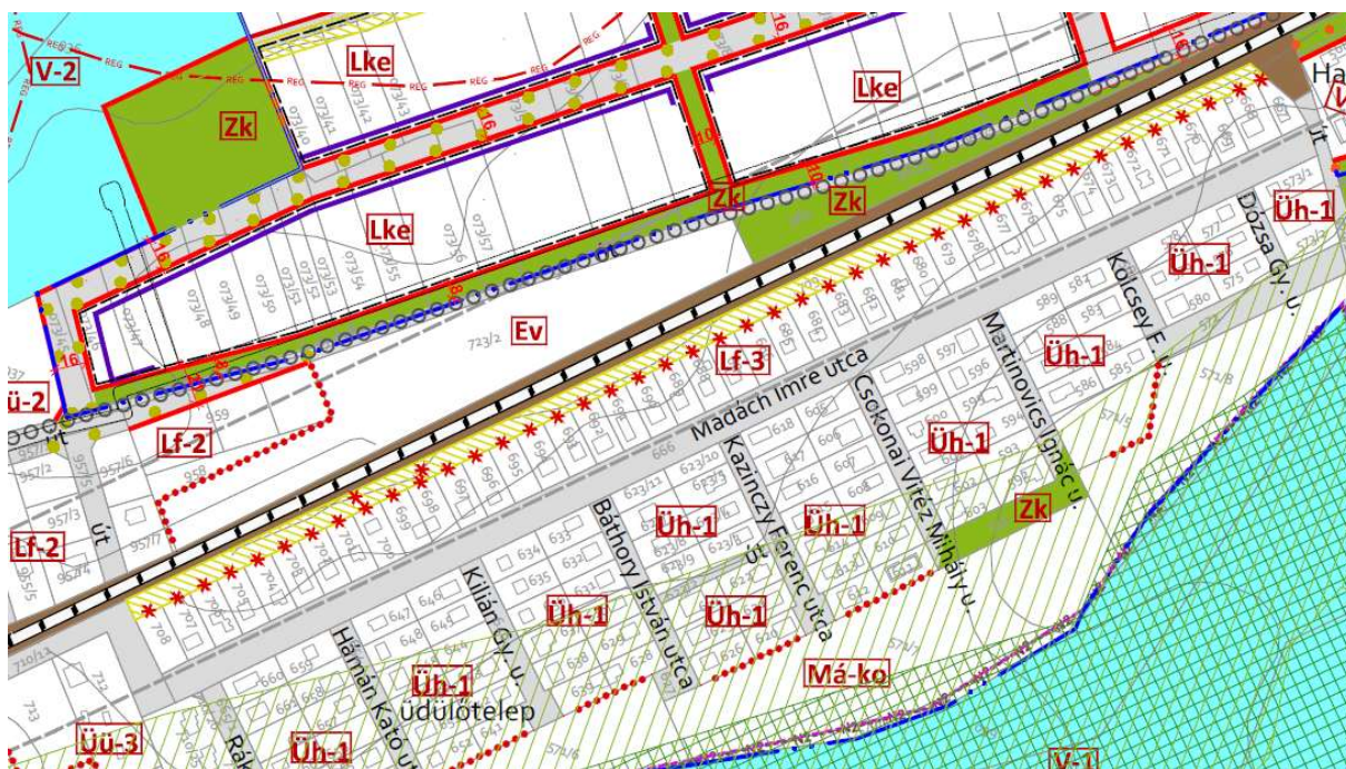
részlet a hatályos szabályozási tervből

A Balatonudvari község helyi építési szabályairól szóló 3/2020. (V. 20.) önkormányzati rendelet (HÉSZ) 1. mellékletét képező szabályozási terv értelmében a Madách utca északi oldalán található hrsz. 667-708. alatti már beépült telkek, valamint a tőlük északra húzódó hrsz. 709. alatti telek azonos, Lf-3 jelű falusias lakóterület építési övezetbe soroltak. A szabályozási terv a hrsz. 709. alatti telek teljes területét „telek nem beépíthető zöldfelületi része”-ként, valamint az egyes, már beépült telkek felőli telekhatárát megszüntetendőként jelöli. Mindezek alapján kijelenthető, hogy Madách utca északi oldalán található telkek és a tőlük északra található hrsz. 709. alatti telek részenkénti összevonása nem ellentétes a HÉSZ előírásaival, sőt, a szabályozási terven jelölt településrendezési szándék is a telkek egyesítése. Az utca északkeleti felén található telkek mai állapota szerint a fentiekben részletezett telekrész vásárlás és telekösszevonás a hrsz. 668-675. alatti telkek esetében már meg is történt.